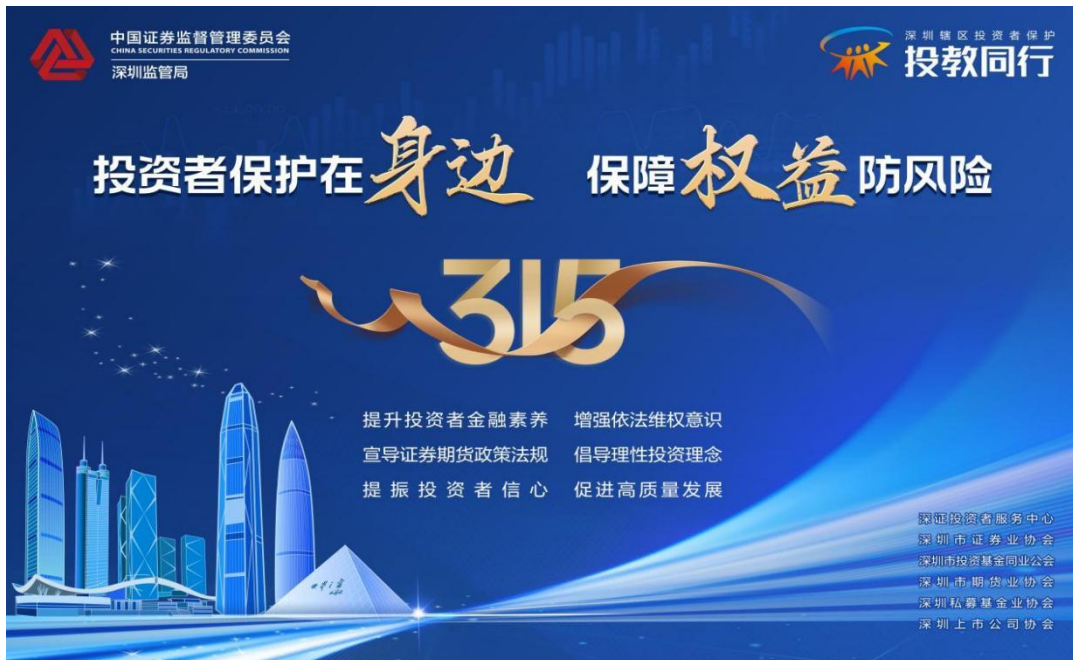
深圳证监局组织开展3·15投教宣传活动

今年3月份，深圳证监局全方位组织开展了“3·15”投教宣传活动。一是统筹多方资源，发挥大投保体制机制优势作用；二是丰富活动形式，打造量质并举的投教服务体系；三是做好财商教育，构筑投资者金融素养根基。