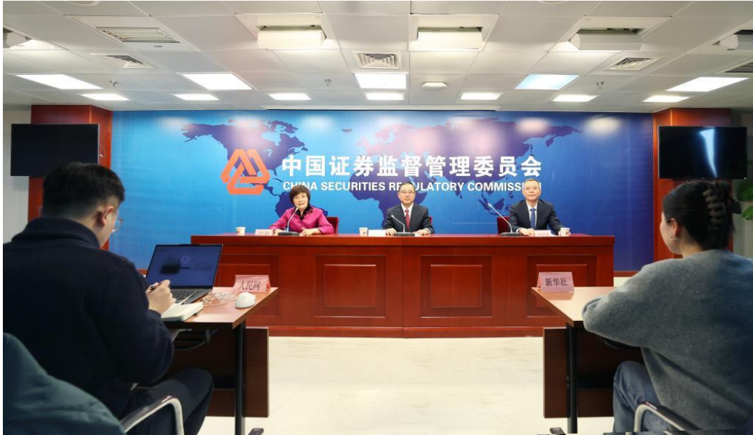
证监会首席检查官、稽查局局长李明在新闻发布会上