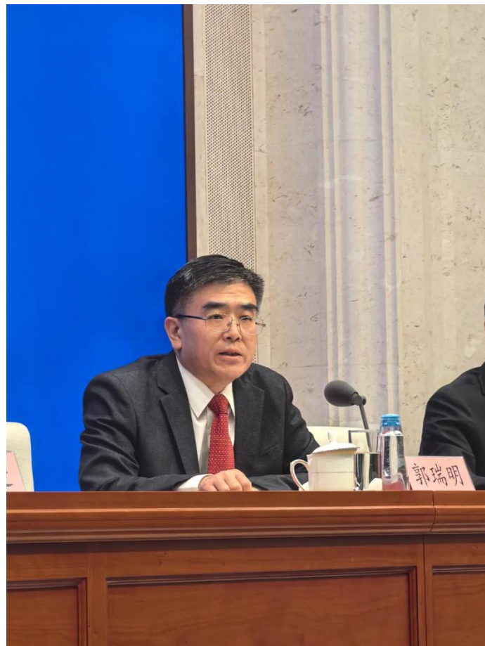
图为证监会上市司司长郭瑞明在国新办新闻发布会上

最后，强化公司内控防线建设。上市公司内部有效的内控体系是防止系统性财务舞弊非常重要的基础，重点是压实公司董事会，特别是审计委员会和独立董事在反舞弊方面的职能，发挥公司治理内部制衡的作用。同时鼓励内部人举报，研究提高举报奖励金额。压实中介机构“看门人”责任，对于丧失职业操守、串通舞弊的这些中介机构，坚决从重处罚，坚决适用禁业罚等硬措施，同时要督促审计评估机构及时发现、主动报告发现的上市公司财务造假线索，对于主动报告的，可以依法从轻或者减轻处罚，这样做的目的是让造假者无处藏身。