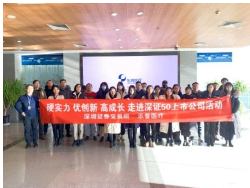
“走进上市公司”活动之乐普医疗

“投教大讲堂”邀请市场专业人士主题授课，旨在帮助投资者提升证券知识水平和投资分析能力。