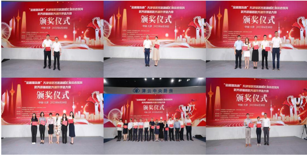
天津证监局联合中金所举办“金融期货杯”社区网格化投资者教育 优秀讲师和优秀课件评选大赛

今年3月份，深圳证监局全方位组织开展了“3·15”投教宣传活动。一是统筹多方资源，发挥大投保体制机制优势作用；二是丰富活动形式，打造量质并举的投教服务体系；三是做好财商教育，构筑投资者金融素养根基。