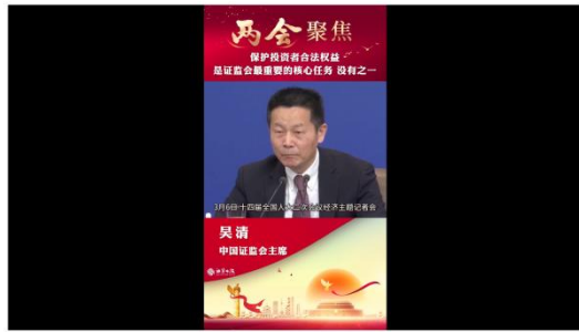
本报两会报道组 张翔

“但是，由于市场参与各方在资金、技术、信息等方面都有很多差异，监管者要特别关注公平问题，把公开公平公正在作为最重要的原则，在我们这样一个中小投资者占绝大多数的市场，更是如此。”吴清表示，所以，保护投资者特别是中小投资者合法权益是证监会最重要的核心任务，可以说没有之一，这也是资本市场监管工作政治性、人民性的直接体现。