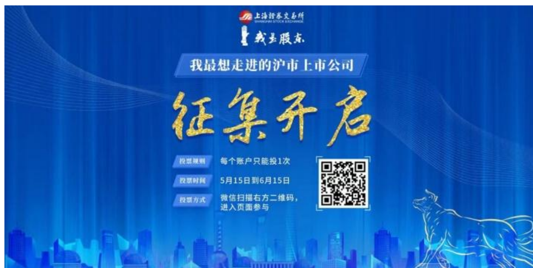
“我最想走进的沪市上市公司”网络征集活动宣传海报

在“主题活动”栏目中，2023年，上交所“我是股东”品牌投教活动再次升级：活动将以“拥抱注册制 共享高质量”为主题，面向全网开放目标公司征集，五大市场服务基地集中走进，“投资者服务周”线下走进，主流财经媒体线上走进，会员单位联合走进——贯穿全年各地。同时，2023年，“我是股东”活动首次面向全市场进行“我最想走进的沪市上市公司”网络征集活动，上交所根据征集情况，综合考虑组织活动，共同探索上市公司与投资者沟通交流活动新形式。