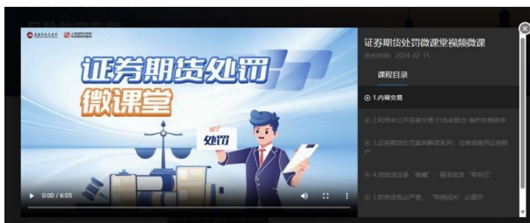
《证券期货处罚微课堂》视频微课

具体来看，在“证券学院”栏目中，上交所通过开设证券基础知识专题、风险教育专题、适当性管理专题和年报专题等四门“必修课”，让广大投资者掌握进入资本市场的基本知识。